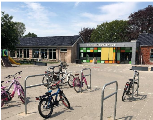
Plein voorzijde school

De kinderen uit de kleutergroepen en groep 3 parkeren hun fiets aan de voorzijde van school in het parkeervak. De kinderen uit de groepen 4 t/m 8 parkeren hun fiets aan de achterzijde van de school.